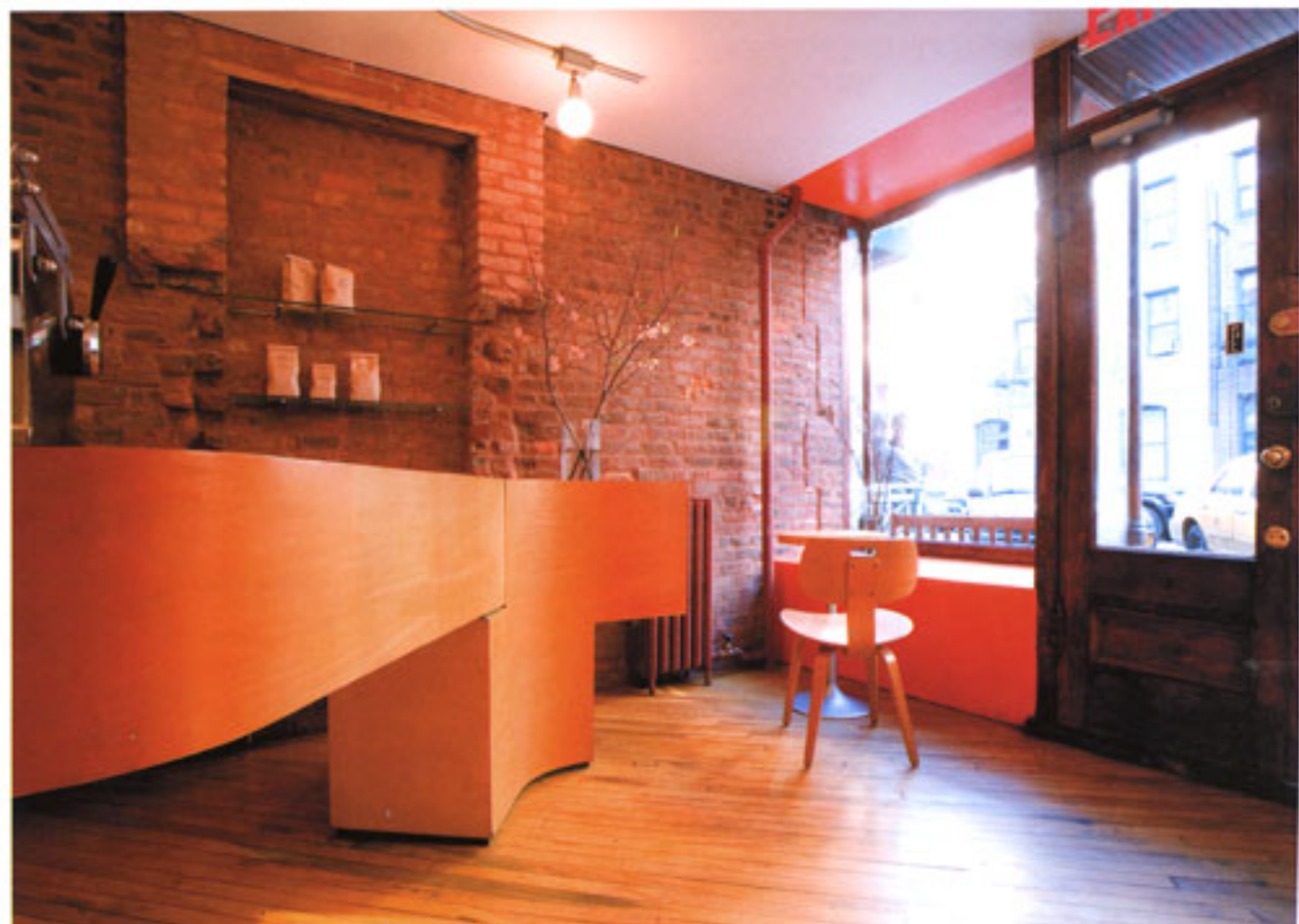
A : Multi-functional cafe counter viewed from the inner B : Cafe counter viewed from the entrance C : Seating area on the right side of the entrance